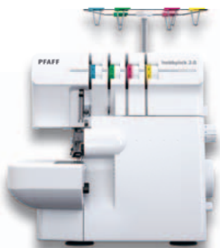
Multifunktionell | Schnell | Präzise